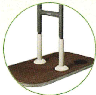
中央にも設置可能