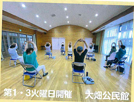
第1・3火曜日開催 大畑公民館