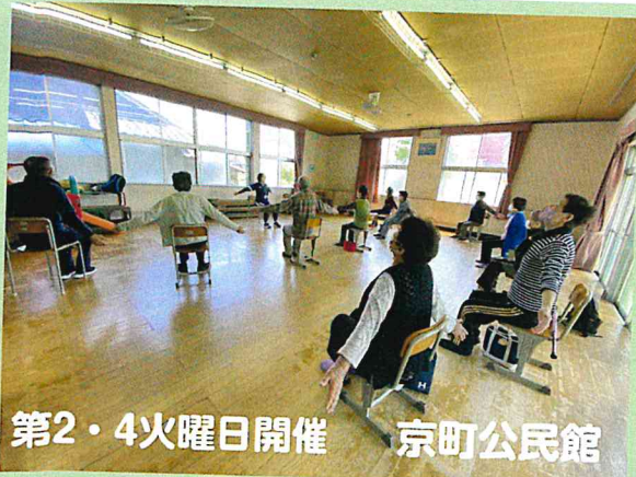
第2・4火曜日開催 京町公民館